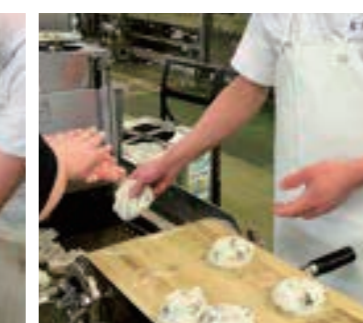
商品製造(成形加熱)

かまぼこの形に成形して蒸したり焼いたり、てんぷら(揚げかまぼこ)を手作業または機械で成形して作ります。